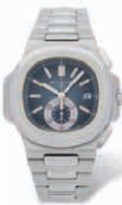
PATEK PHILIPPE Nautilus Chronograph. Référence 5980/1A.