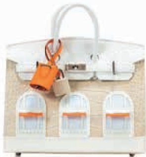
HERMÈS "BIRKIN FAUBOURG" Sellier 20 cm version Neige.