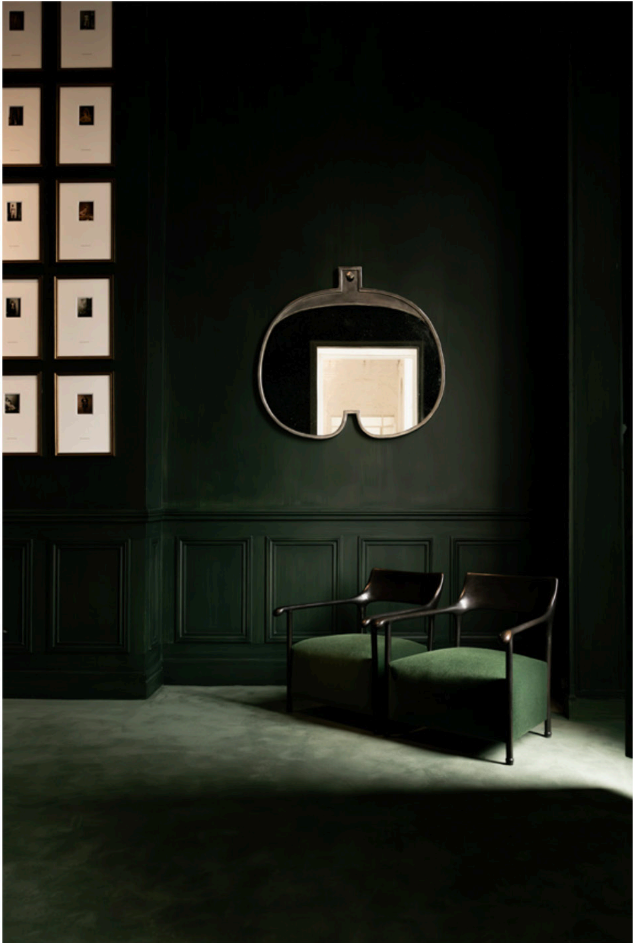
Exposition In Situ de Charles Zana