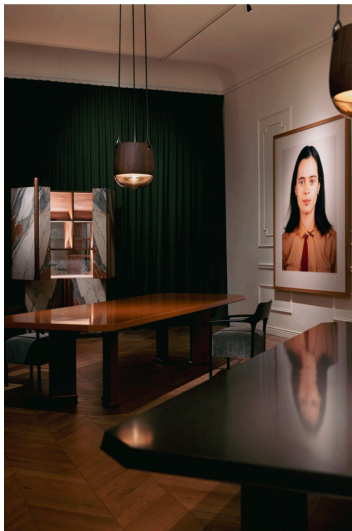
Exposition In Situ de Charles Zana

Signature d'intérieurs remarquables aux quatre coins du monde, Charles Zana a imaginé cet ensemble sans fil rouge, simplement guidé par l'idée d'une « collection en mouvement ». Au-delà de l'aspect formel qui ne se confine pas à un style, l'architecte d'intérieur et designer se laisse guider « par des meubles qui architecturent l'espace ». Considérant qu'il n'y aurait pas « une seule façon bourgeoise de s'implanter dans l'espace », mais au contraire une réflexion « proche de celle des ensembliers », l'exposition met en avant la pluralité des formes et des matières. À celles traditionnelles comme le bronze, le marbre, le cuir ou encore l'acier inoxydable, Charles Zana intègre pour la première fois de nouveaux médiums comme la laque, l'étain ou la céramique, tous travaillés en France.