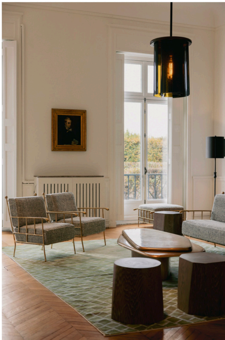
Exposition In Situ de Charles Zana

L'exposition est à voir au 242 rue de Rivoli, de 11 h à 19 h jusqu'au dimanche 26 octobre.