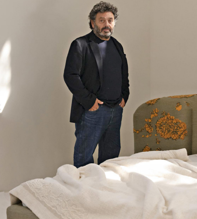
Près de la tour Eiffel, un appartement repensé par l'architecte pour un couple d'amateur d'art. An apartment near the Eiffel Tower, redesigned by the architect for a couple who loves art.